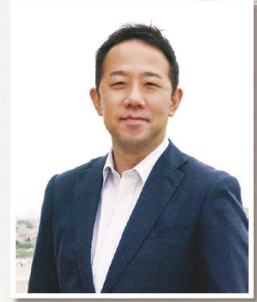
医療法人 好生会 理事長