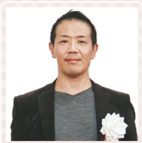
コミュニティホスピタル甲賀病院 院長