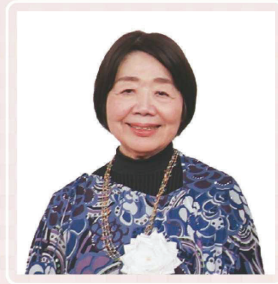
社会医療法人 駿甲会 理事長