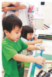
通所リハビリテーションセンター