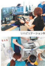
リハビリテーション科 薬剤科