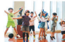
【スペシャルステージ】 当法人学童所いっしょの 子どもたちによるキッズダンス

各ブース 14の部署がブースを出展し、お子さまからご年配の方まで皆さんの笑顔が見られました！